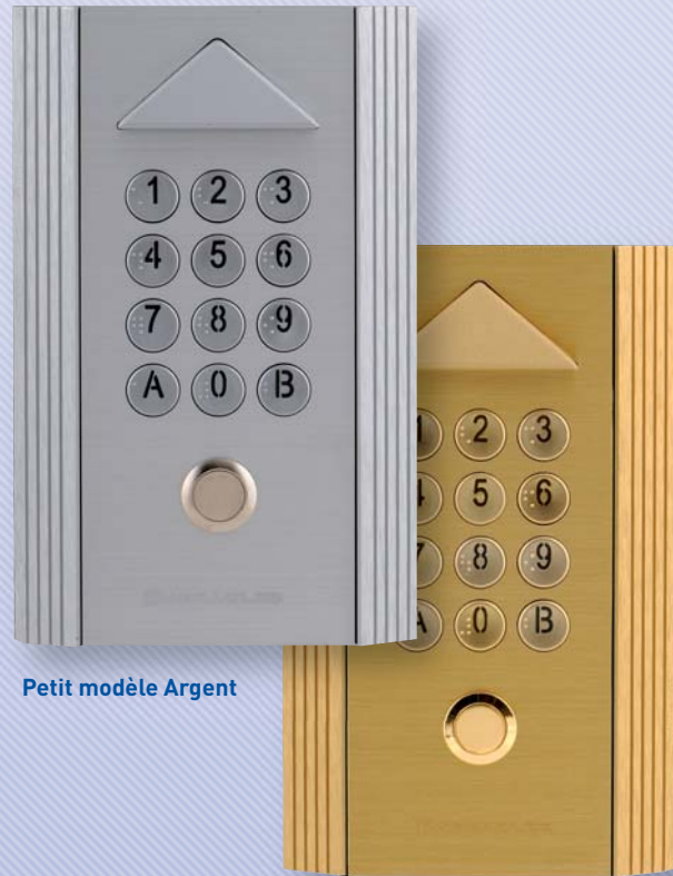
Petit modèle Argent