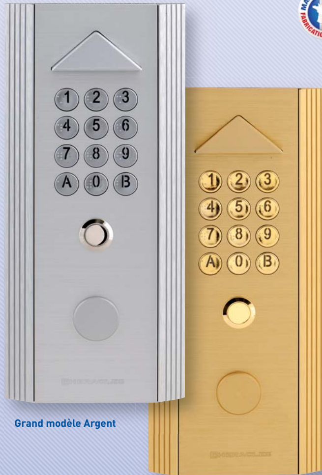
Grand modèle Argent